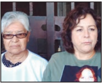
Familiares de desaparecidos piden a la FGE reanudar búsquedas

Colectivos hallan restos de 40 personas con peritos independientes